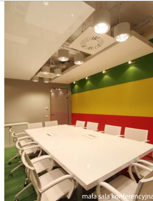
mała sala konferencyjna

P.S.: Ciekawe rozwiązania zawarliśmy w projektach stołów konferencyjnych. Większość poprzednich mebli tego typu, jakie zdarzyło mi się zaprojektować, to stoły szklane, kamienne czy fornirowane z wykorzystaniem MDF. Przeważnie były one oparte na ciężkiej konstrukcji. W przypadku MTV Networks Polska założenie (zwłaszcza dla dużej sali konferencyjnej) przewidywało konieczność zastosowania stołu modularnego o zmiennej konfiguracji ułożenia blatów, z możliwością wystawienia wszystkich modułów na zewnątrz sali. W związku z powyższym stół musiał być lekki i podzielony na mniejsze blaty. W projekcie stołu zastosowałem płytę komórkową, która jest nie tylko lekka, lecz także jest powszechnie uznana jako materiał ekologiczny. Modularne blaty stołu wykończone zostały wysokiej jakości błyszczącymi laminatami. Zdecydowałem się na różnicowanie kolorów poszczególnych modułów zarówno ze względów artystycznych, jaki też czysto estetycznych.