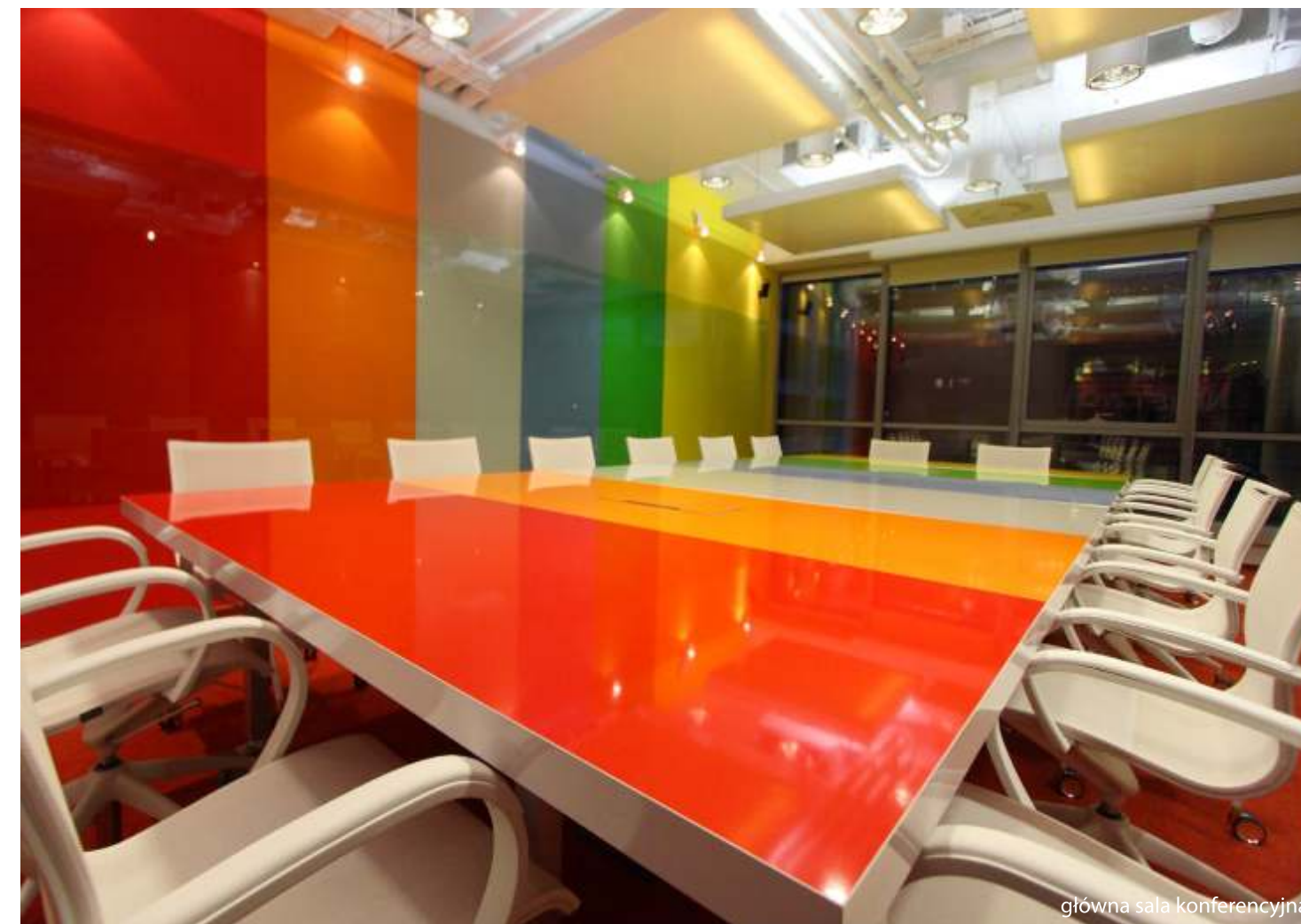
główna sala konferencyjna

P.S.: Pewne elementy związane z oddaniem dynamicznego charakteru korporacji powstawały już na etapie space planu. Po zaakceptowaniu przez MTV Networks Polska ogólnego układu funkcjonalnego, czyli space planu w wybranym budynku, sztywny ortogonalny układ geometrii ścian został przez nas urozmaicony. Stworzyliśmy ściany delikatnie przelamane, biegnące do siebie pod różnymi kątami, nie zakłócające jednocześnie istniejących ciągów komunikacyjnych czy ustawności pomieszczeń.