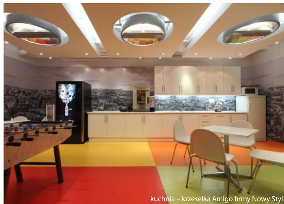
kuchnia – krzeselka Amigo firmy Nowy Styl