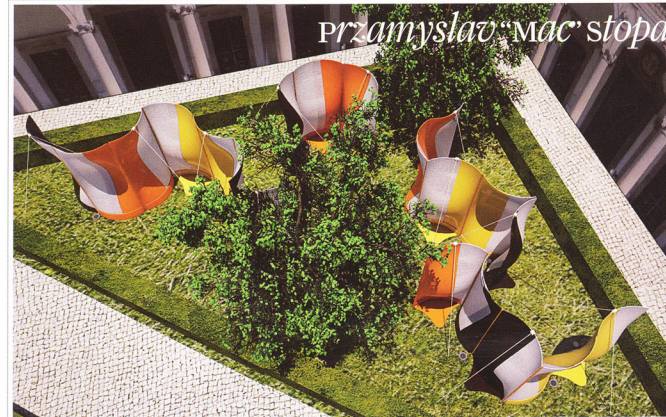
Przemyslaw "Mac" stopa

Questi sono gli elementi che l'architetto ha voluto riprodurre e reinterpretare in chiave contemporanea nell'installazione Flow: il flusso che dà il nome al progetto è generato da venti pannelli termoformati di Staron che presentano una geometria a onde, emisferica e organica, valorizzata attraverso l'uso di colori contrastanti, dal cioccolato al giallo, dall'arancione al bianco. Una miscela cromatica che evoca gli Impressionisti, ma anche le tinte della grafica e della moda. Solid Staron Surface, materiale di nuova generazione composto da minerali naturali legati con acrilico e caratterizzato da resistenza e flessibilità, è un prodotto di Samsung Cheil Industries, partner dell'installazione.