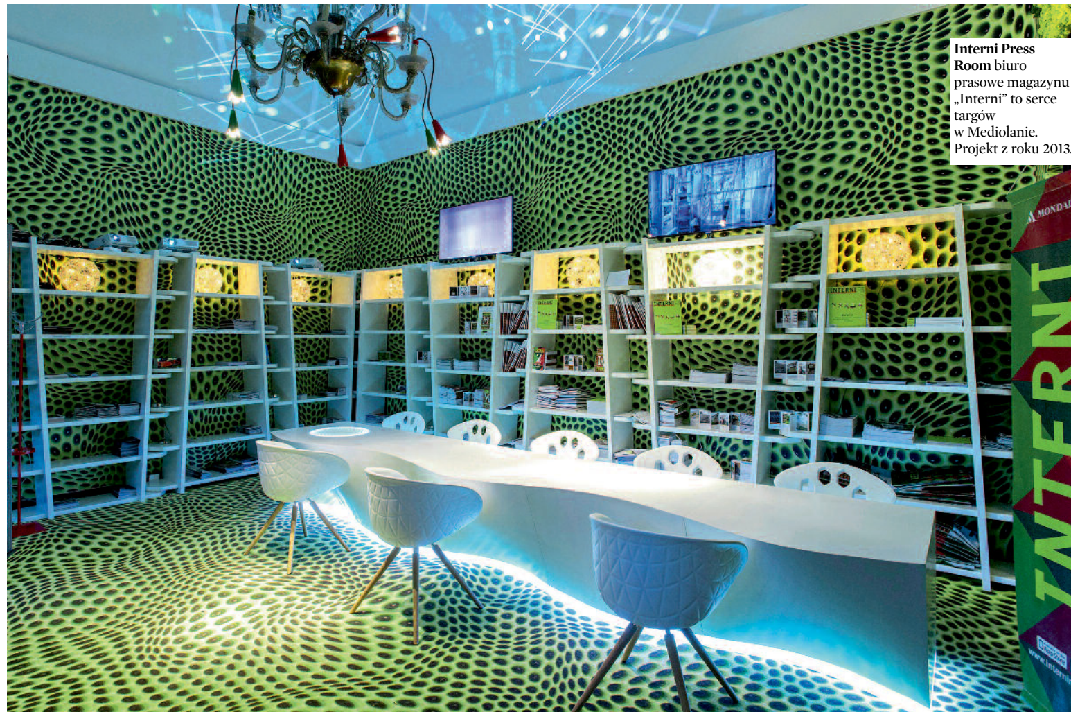
Interni Press Room biuro prasowe magazynu „Interni” to serce targów w Mediolanie. Projekt z roku 2013.

Daliśmy się im uwieść. I my, i decydenci wielkich firm. Nasi designerzy śmiało wracają na światowe salony projektowania. Nie mają kompleksów, patrzą w przyszłość, proponują nowe rozwiązania. Oto piątka wspaniałych!