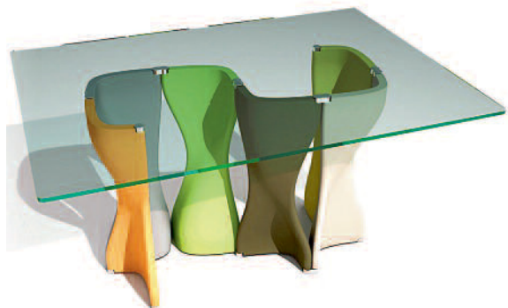
Mac’s Table innowacyjny stół z podstawą, która może służyć zarówno do blatów prostokątnych, jak i okrągłych. Premiera podczas Salone Internazionale del Mobile w Mediolanie w roku 2014.