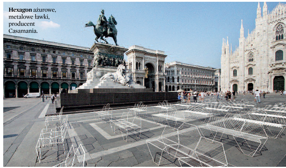
Hexagon azurowe , metalowe ławki, producent Casamania.