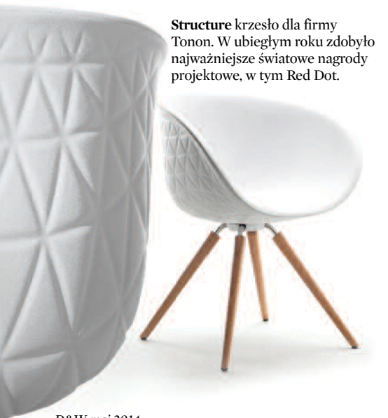
Structure krzesło dla firmy Tonon. W ubiegłym roku zdobyło najważniejsze światowe nagrody projektowe, w tym Red Dot.