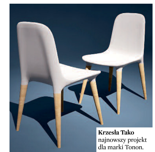
Krzesła Tako najnowszy projekt dla marki Tonon.