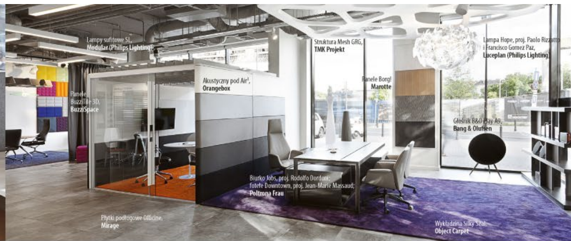
Lampy sufitowe SL Modular (Philips Lighting)