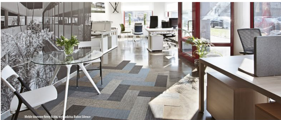
Mebel biurowe firmy Actiu, wykładzina Bolon Silence