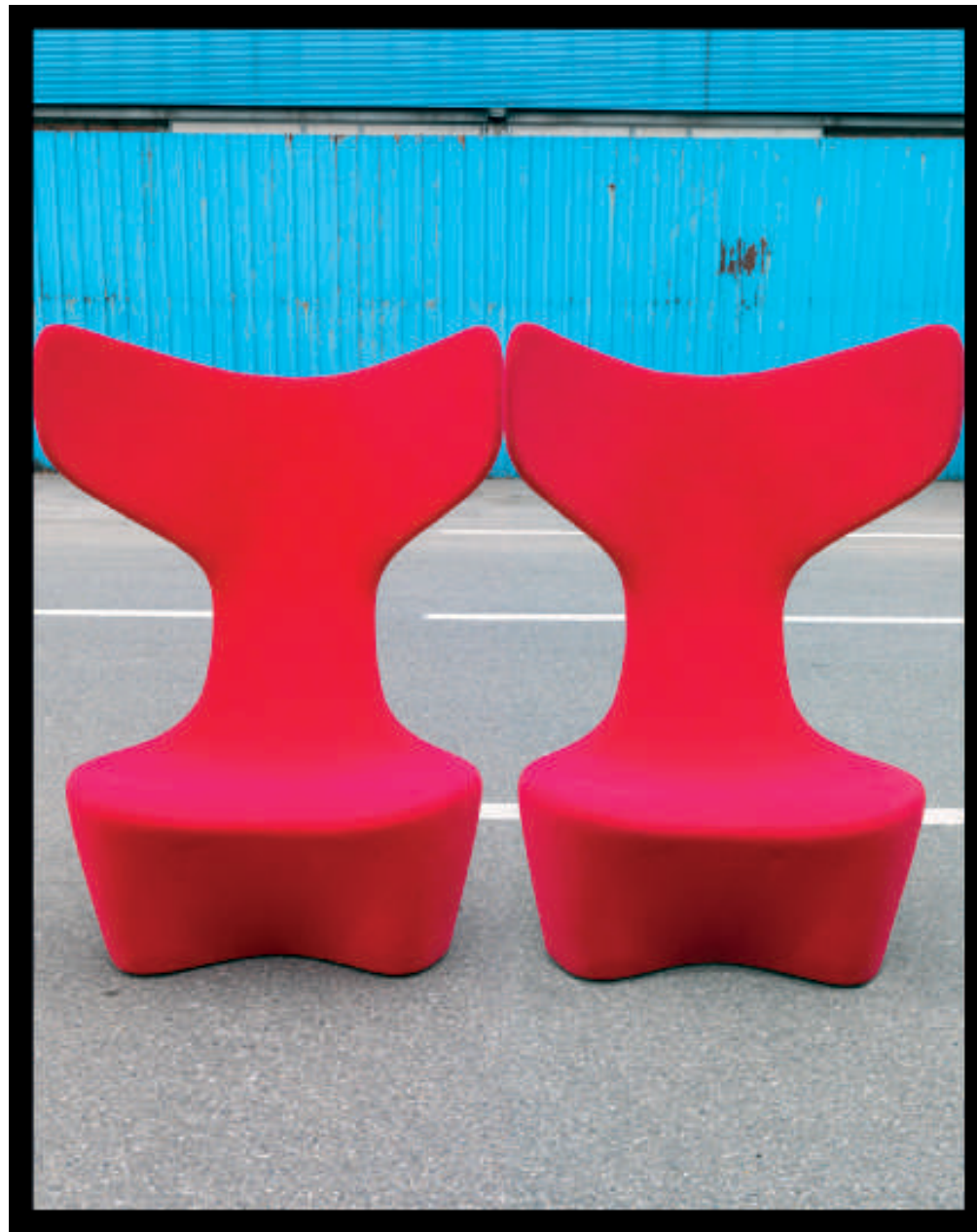
Drum, poltrona per grandi aree in poliuretano stampato a quote differenziate con rivestimento in tessuto elasticizzato o pelli Cappellini in diversi colori oppure in tessuto con stampa tridimensionale in tre varianti cromatiche. Design Mac Stopa per Cappellini . Nella pagina accanto: Botero, divano con struttura in acciaio, imbottiture in poliuretano a diverse densità, caratterizzato dall'imbottitura integrata in piumino super morbido dello schienale; rivestimento in tessuto e piedini in lega di alluminio. Design Damian Williamson per Zanotta .