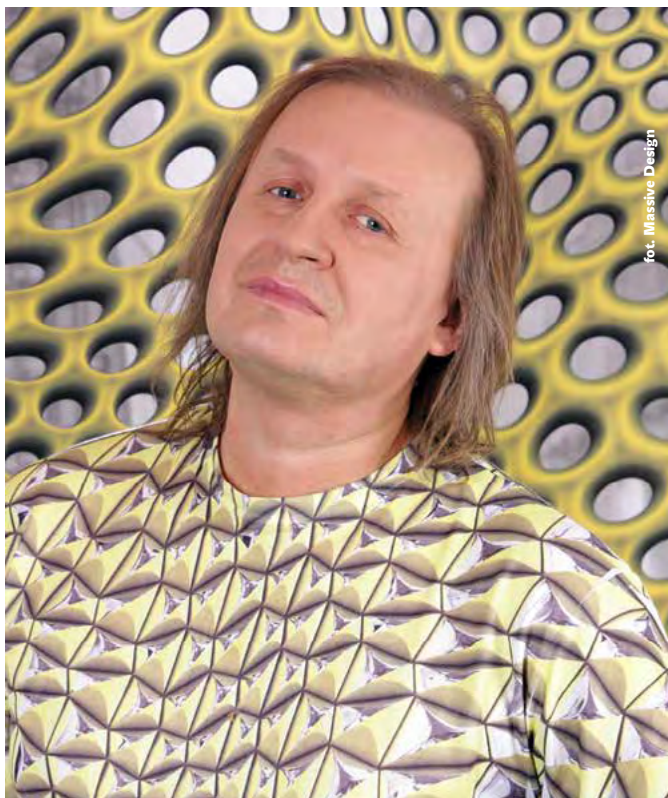
fot. Massive Design

Pracodawcy zdążyli już dostrzec, że nowoczesne biuro to znacznie więcej niż powierzchnia, na której można jedynie pracować. Ale projektowanie przestrzeni biurowej dla tzw. millenialsów kryje za sobą więcej wyzwań. O tym jak obecność pokolenia Y diametralnie wywróciła podejście do aranżacji przestrzeni biurowej opowiada Przemysław „Mac” Stopa, założyciel i główny architekt nagradzanej w Europie i na świecie pracowni architektonicznej Massive Design