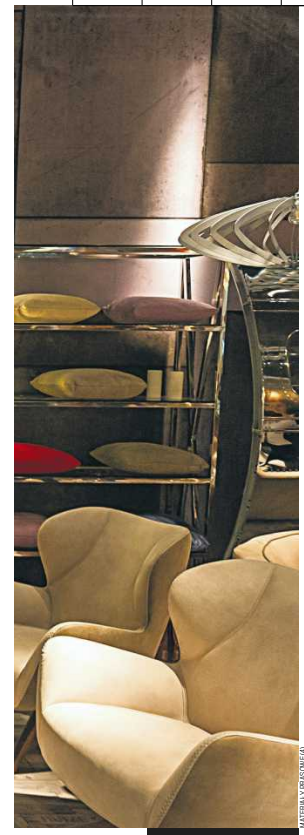
W biurze przyszłości musi być miejsce, w którym można uciec choć na chwilę od schematów