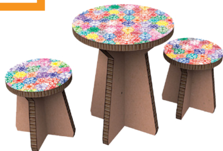
ESSENTIAL DESIGN MATTEO RAGNI PLYNO TAVOLINO E SGABELLI IN CARTONE FSC ALVEOLARE. SMONTABILI DECORO DI N.V.A.S. - LEA RAGNI TABLE AND STOOLS IN FSC HONEYCOMB CARDBOARD, FOR EASY DISASSEMBLY. DECORATION BY LEA RAGNI. essential.com