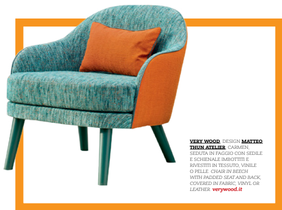
VERY WOOD DESIGN MATTEO TRUN ATTELIER CARMEN SEDUTA IN FAGGIO CON SEDILE E SCHIENALE IMBOTTITI E RIVESTITI IN TESSUTO, VINILE O PELLE. CHAIR IN BEECH WITH PADDED SEAT AND BACK COVERED IN FABRIC, VINYL OR LEATHER. verywood.it