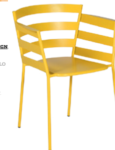
FERMOB DESIGN ARCHIVIO VOLTODESIGN RYTHMIC, POLTRONCINA PER OUTDOOR IN METALLO VERNICIATO IN 24 DIVERSE TONALITÀ. OUTDOOR CHAIR IN METAL, PAINTED IN 24 DIFFERENT TONES. fermob.com