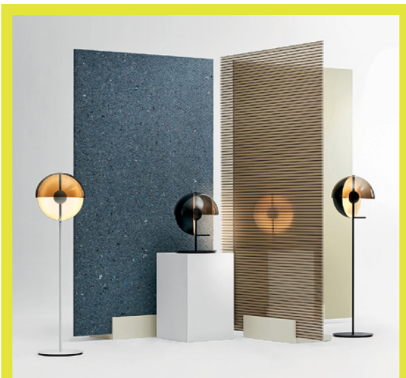
MARSET DESIGN MATHIAS HAHN , THEIA, COLLEZIONE DI LAMPADE COMPOSTA DA DUE SEMISFERE CHE SI INTERSECONO, UNA POSTA ORIZZONTALMENTE, L'ALTRA VERTICALMENTE. RUOTANDO IL PRODOTTO, È POSSIBILE OTTENERE UNA LUCE DA LETTURA O UN'ILLUMINAZIONE D'AMBIENTE. COLLECTION OF LAMPS COMPOSED OF TWO INTERSECTING SEMISPHERES, ONE HORIZONTAL AND ONE VERTICAL. THE LAMP CAN BE ROTATED TO PRODUCE READING LIGHT OR AMBIENT LIGHT. marset.com