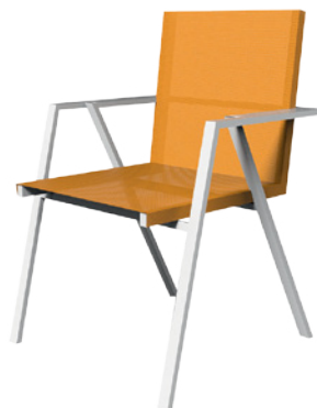
FRIGERIO LIVING DESIGN ROBERTO SEMPRINI TWO LEGS, SEDIA OUTDOOR IMPILABILE, IN ALLUMINIO VERNICIATO BIANCO E SEDUTA CON TESSUTO IN PVC IN DIVERSI COLORI. STACKABLE OUTDOOR CHAIR IN WHITE PAINTED ALUMINIUM. SEAT IN PVC IN A RANGE OF COLORS. frigerioliving.com