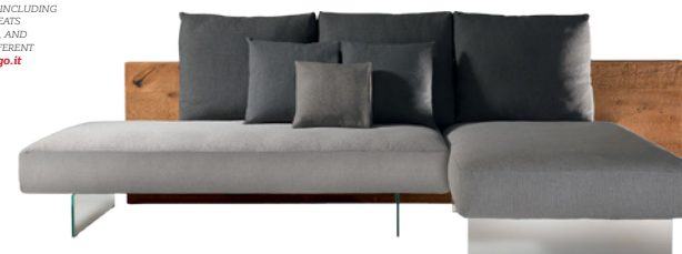
LAGO DESIGN DANIELE LAGO AIR WILDWOOD SOFA, SISTEMA MODULARE CHE COMPRENDE SCHIENALI IN LEGNO. SEDUTE IN DIVERSE MISURE E BRACCIOLE COMBINABILI PER VARIE CONFIGURAZIONI. MODULAR SYSTEM INCLUDING WOODEN BACKS, SEATS IN DIFFERENT SIZES, AND ARMRESTS FOR DIFFERENT COMBINATIONS. lago.it