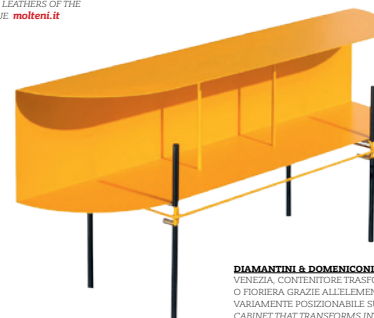
DIAMANTINI & DOMENICONI DESIGN MARCO MARZINI VENEZIA, CONTENITORE TRASFORMABILE IN TAVOLINO O FIORIERA GRAZIE ALLELEMENTO IN LAMIERA PIEGATA VARIAMENTE POSIZIONABILE SULLA STRUTTURA IN METALLO. CABINET THAT TRANSFORMS INTO A TABLE OR PLANTER THANKS TO A PIECE OF BENT METAL THAT CAN BE PLACED AT DIFFERENT POSITIONS ON THE METAL STRUCTURE. diamantinidomeniconi.it