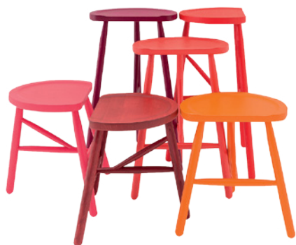
BILLIANI DESIGN EMILIO NANNI PUCCIO, SERIE DI SGABELLI ALTI E BASSI, IN LEGNO TINTO ISPIRATI AGLI SGABELLI PER LA MUNGITURA. SERIES OF HIGH AND LOW STOOLS IN STAINED WOOD, BASED ON MILKING STOOLS. billiani.it