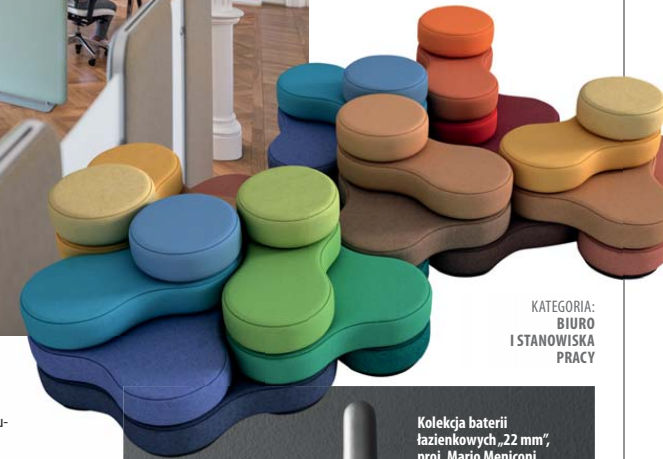
KATEGORIA: BIURO I STANOWISKA PRACY