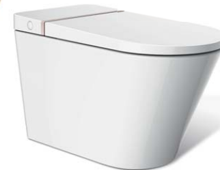
Sedes „Primus”, proj. Dean Dong, prod. Axent (Szwajcaria)

„Primus” nie ma widocznego zbiornika na wodę. Zbiornik (5 l) jest zintegrowany z ceramiką i to rozwiązanie Vacuum V Flush zostało opatentowane przez producenta. Technologia Easy Clean znacznie ułatwia mycie i utrzymanie urządzenia w czystości.