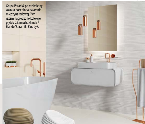
Grupa Paradyż po raz kolejny została doceniona na arenie międzynarodowej. Tym razem nagrodzono kolekcję płytek ściennych „Elanda / Elando” Ceramiki Paradyż.