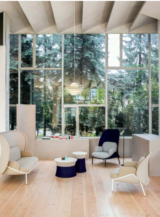
„Mesh”, proj. Krystian Kowalski, prod. Fabryka Mebli Biurowych MDD. Ten elegancki mebel o współczesnym charakterze został zaprojektowany zgodnie z ideą customizacji, dostosowuje się do potrzeb miejsca i pracowników.