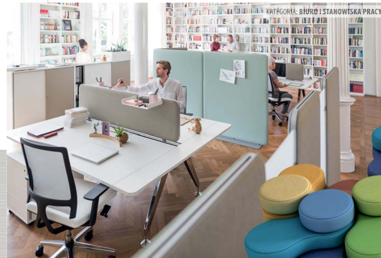
KATEGORIA: BIURO I STANOWISKA PRACY