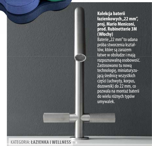
KATEGORIA: ŁAZIENKA I WELLNESS

„Primus” nie ma widocznego zbiornika na wodę. Zbiornik (5 l) jest zintegrowany z ceramiką i to rozwiązanie Vacuum V Flush zostało opatentowane przez producenta. Technologia Easy Clean znacznie ułatwia mycie i utrzymanie urządzenia w czystości.