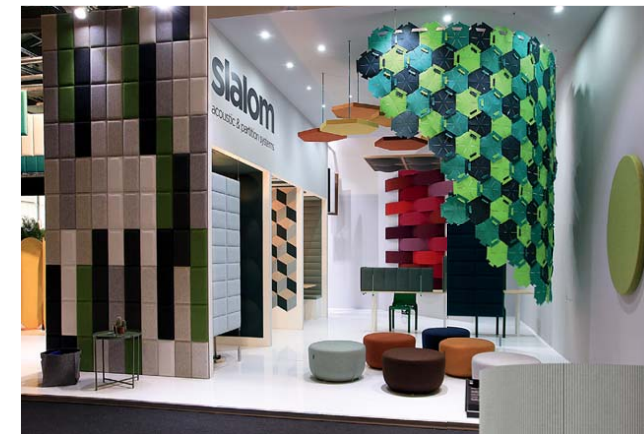
Firma Slalom zaprezentowała w Mediolanie swoje najnowsze rozwiązania akustyczne do biur i wnętrz publicznych.