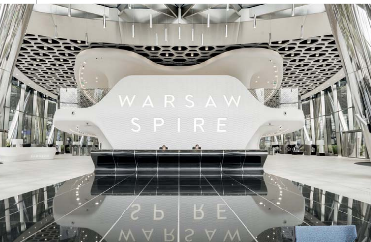
Wnętrze biurowca Warsaw Spire, proj. Mac Stopa / Massive Design.