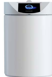
Autoklaw mikrofalowy do sterylizacji mediów płynnych „Microjet”, proj. Brandspot, prod. Enbio Technology.