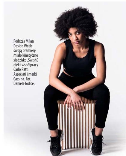
Podczas Milan Design Week swoją premierę miało kinetyczne siedzisko „Swish”, efekt współpracy Carlo Ratti Associati i marki Cassina.