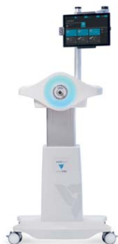
Robot rehabilitacyjny „Luna EMG”, proj. Husarska Design Studio, prod. Egzotech.