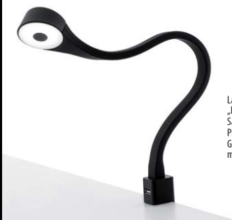
Lampa nocna „Flexi”, proj. Saidi'sign Produkt und Grafikdesign dla marki Fumika.