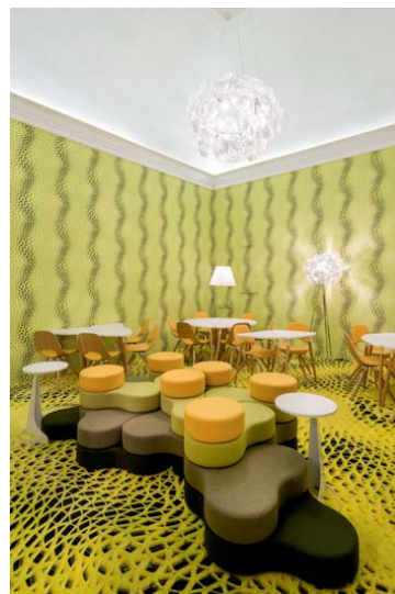
Instalacja zaprojektowana przez Przemysława Mac Stopę dla wydawnictwa „Interni” – „Immaterial Dream Interni Press Office”, w której znalazły się meble zaprojektowane przez Przemysława Mac Stopę dla Grupy Nowy Styl (krzesła i stoliki „Tauko”, pufy „Tapa”).