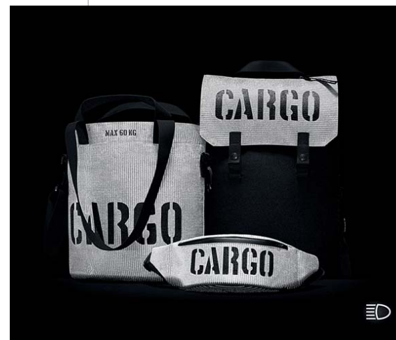
Wyróżnienie honorowe: kolekcja toreb i plecaków „Cargo Reflective”, proj. i prod. Migfactory Anna Migacz-Lesińska.