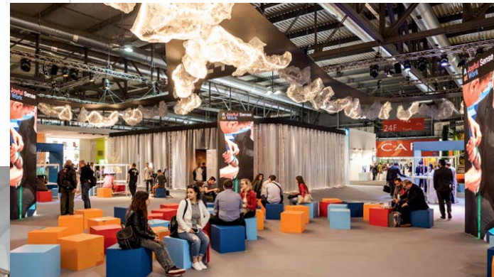
Fragment ekspozycji „A Joyful Sense at Work”, która towarzyszyła biennale „Workplace3.0.”.