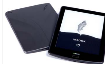
Czytnik ebooków „inkBOOK”, proj. Arta Tech, id group, prod. Arta Tech.