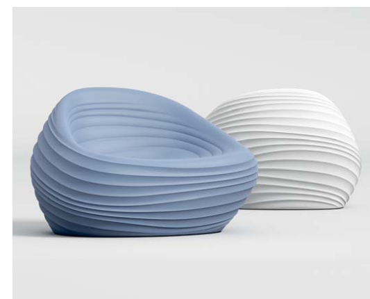
Fotel „Riverside”, proj. Mac Stopa dla marki Tonon.