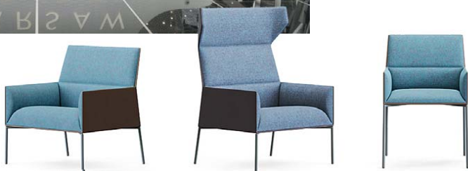
Kolekcja mebli „Chic Air”, proj. Agence Christophe Pillet, prod. Profim.